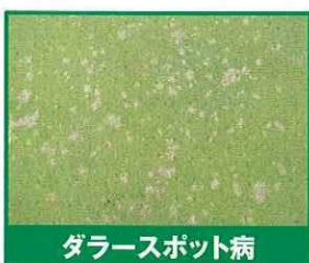
ダラースポット病