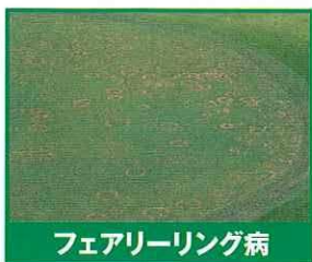
フェアリーリング病