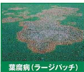
葉腐病(ラージパッチ)