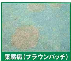
葉腐病(ブラウンパッチ)