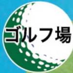
グリーン周りの メヒシバ発生初期に